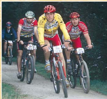
Un parcours sportif et historique

Le calvaire du cimetière a été inscrit à l'inventaire supplémentaire des monuments historiques en 1930.