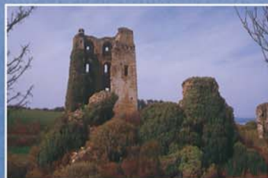
Le Donjon de Trémazan

Le donjon de Trémazan à Landunvez 10 12 , est un héritage du XIV ème siècle constituant un témoignage rare sur l'architecture militaire et seigneuriale en Bretagne. Le château fut habité jusqu'à la fin du XVI ème siècle par la famille Du Chastel dont plusieurs membres s'illustrèrent dans l'histoire du duché de Bretagne et de la monarchie française.