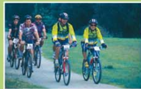
Une sortie entre amis

Hébergement : — Restauration : X Alimentation : X