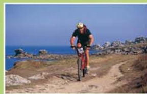
La randonnée découverte