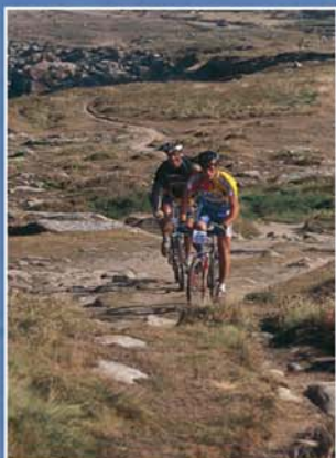
"Le VTT, c'est aussi une sortie entre copains..."

Le chenal du Four 9 10 11 12 est emprunté pour la navigation côtière. Mais prudence, car ici les roches affleurent. Face à vous le phare du Four construit en 1874 (haut de 28m, cinq éclats blancs toutes les 15 secondes).