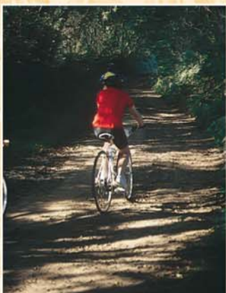
Sur les sentiers de la Fontaine St Ergat

La fontaine Saint Ergat à Tréouergat 6 7 aurait la vertu de guérir quiconque souffrant de rhumatismes... comme ces nombreux pèlerins dans des temps anciens.