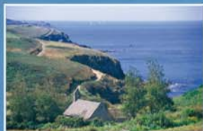
La Chapelle de Loc-Méven à Ploumoguier