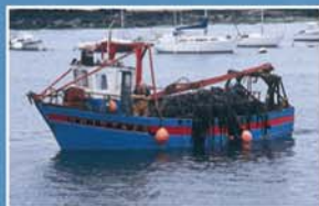
Le charme des ports de pêche