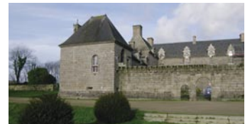
Le château de Kergroadès.

À voir en chemin : le cimetière des saints à Lanivoaré, le château de Kergroadès à Brélès, la chapelle Saint Éloi à Plouzané.