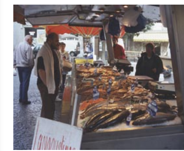
Le samedi à Saint-Renan, marché le plus réputé de la région.